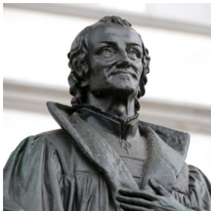
Philipp Melanchthon (1497-1560)